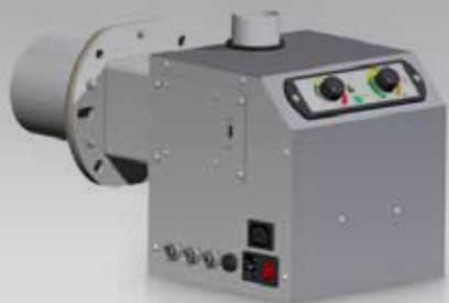
BioMax Easy 25