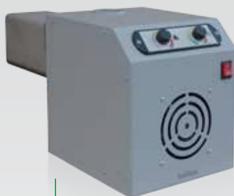
BioMax Easy 50

Ideal para conversão de caldeiras existentes